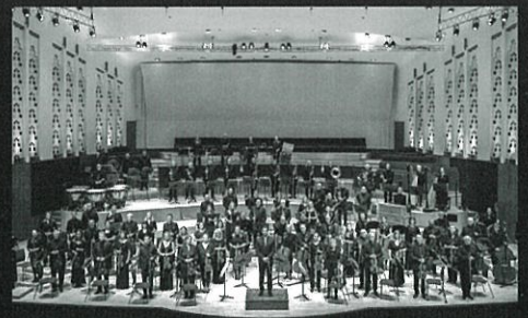
ロイヤル・リヴァプール・フィルハーモニー管弦楽団 Royal Liverpool Philharmonic Orchestra

ベネズエラのカラカス生まれ。2021年9月、ロイヤル・リヴァプール・フィルハーモニー管弦楽団の首席指揮者に就任。マックス・ブルッフ、サー・マルコム・サージェント、ヴァシリー・ペトレンコら著名な指揮者たちに名を連ねることとなった。ベネズエラの有名な音楽教育プログラムであるエル・システムのメンバーを経て、ヨーロッパへ渡りジュネーヴ高等音楽院で指揮を学んだ。2013年から2016年までベルリン・ドイツ国立歌劇場でダニエル・バレンボイムの第1アシスタントを務めた後、2019年から2022年まではポーランド国立放送響の首席客演指揮者として活躍。このほかメトロポリタン歌劇場、ウィーン国立歌劇場、パリ国立オペラ座、マリンスキー劇場、フィルハーモニア管、ドレスデン・フィル、ザルツブルク・モーツァルト管、フランス国立放送フィル、新日本フィル、ベネズエラ・シモン・ボリバル響に客演するなど活躍の場を広げている。ロイヤル・リヴァプール・フィルとの首席指揮者契約を2028年8月まで延長した。