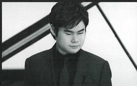
辻井伸行(ピアノ) Nobuyuki Tsujii, Piano

2009年「第13回ヴァン・クライバーン国際ピアノ・コンクール」で日本人として初優勝して以来、国際的に活躍している。2011年、ニューヨーク、カーネギーホール主催のリサイタルで驚異的な大成功を収め、以後定期的に同ホールの主催公演に招聘されているほか、ロンドン、ウィーン、パリ、ミラノなど、世界の主要都市でのリサイタルやオーケストラとの共演はいずれも高い評価を受け、欧米の主要コンサートホールや主催者からの出演依頼が数多く寄せられている。また、著名な指揮者や世界的オーケストラからも高く評価されており、ユロフスキ指揮ロンドン・フィル、ケント・ナガノ指揮ハンブルク・フィルなど、著名オーケストラの日本ツアーのソリストに数多く抜擢されているほか、欧米の一流オーケストラの定期公演にもたびたび招聘されている。2024年以降もニューヨーク、ロンドン、パリ、シドニーをはじめとする主要都市での公演や世界的オーケストラとの共演が数多く予定されており、日本を代表するピアニストとしてさらなる飛躍が期待されている。