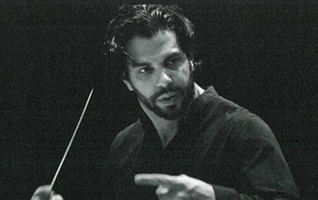
ドミンゴ・インドヤン(指揮) Domingo Hindoyan, Conductor

2009年「第13回ヴァン・クライバーン国際ピアノ・コンクール」で日本人として初優勝して以来、国際的に活躍している。2011年、ニューヨーク、カーネギーホール主催のリサイタルで驚異的な大成功を収め、以後定期的に同ホールの主催公演に招聘されているほか、ロンドン、ウィーン、パリ、ミラノなど、世界の主要都市でのリサイタルやオーケストラとの共演はいずれも高い評価を受け、欧米の主要コンサートホールや主催者からの出演依頼が数多く寄せられている。また、著名な指揮者や世界的オーケストラからも高く評価されており、ユロフスキ指揮ロンドン・フィル、ケント・ナガノ指揮ハンブルク・フィルなど、著名オーケストラの日本ツアーのソリストに数多く抜擢されているほか、欧米の一流オーケストラの定期公演にもたびたび招聘されている。2024年以降もニューヨーク、ロンドン、パリ、シドニーをはじめとする主要都市での公演や世界的オーケストラとの共演が数多く予定されており、日本を代表するピアニストとしてさらなる飛躍が期待されている。